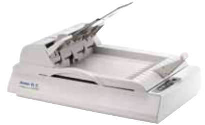
AV2280E mit optionalem Dokumenteneinzug (ADF)

Dokumentenerfassung ist der erste Schritt des Dokumentenmanagements. Allerdings kann schlechte Bildqualität später Probleme bei der Indizierung oder der Ablage der Daten zur Folge haben. Dies treibt die Arbeitskosten und -aufwand in die Höhe und vermindert die OCR Genauigkeit. AVScan 5.0 gewährleistet, daß alle Dokumente direkt während des Scans geprüft werden, so daß die Bildqualität für die Weiterverarbeitung garantiert wird.