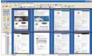
Das Hauptfenster von AvScan 5.0